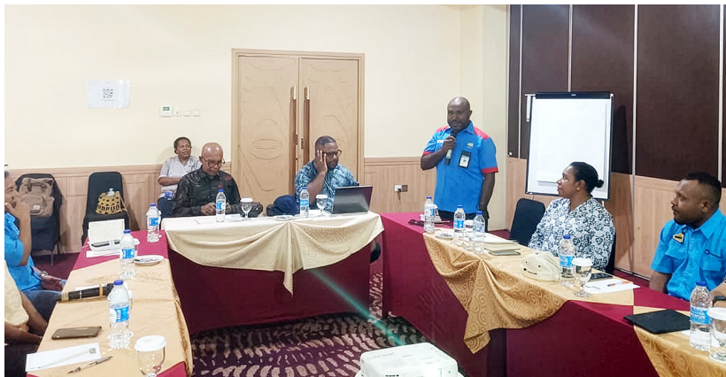
Pelatihan untuk meningkatkan kapasitas karyawan YPMak.

Di balik berbagai rencana tersebut, tersimpan harapan sederhana namun kuat: menghadirkan karyawan yang tidak hanya kompeten, tetapi juga solid dan bersemangat dalam bekerja, sehingga mampu memberikan kontribusi terbaik bagi masyarakat Papua. (ots-1)