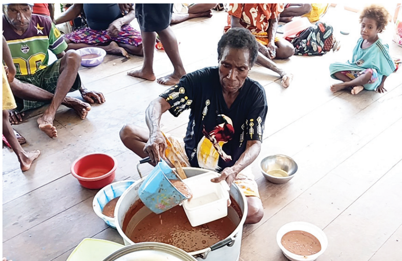
Pemberian makanan tambahan salahsatu kegiatan yang dijalankan dalam Program Kampung Sehat YPMak.

Dalam kondisi ini, model kolaborasi antara YPMak dan fasilitas kesehatan lokal menjadi krusial. Program Kampung Sehat tidak hanya berperan sebagai pelengkap layanan kesehatan formal, tetapi juga sebagai penggerak perubahan perilaku dan peningkatan literasi kesehatan masyarakat.