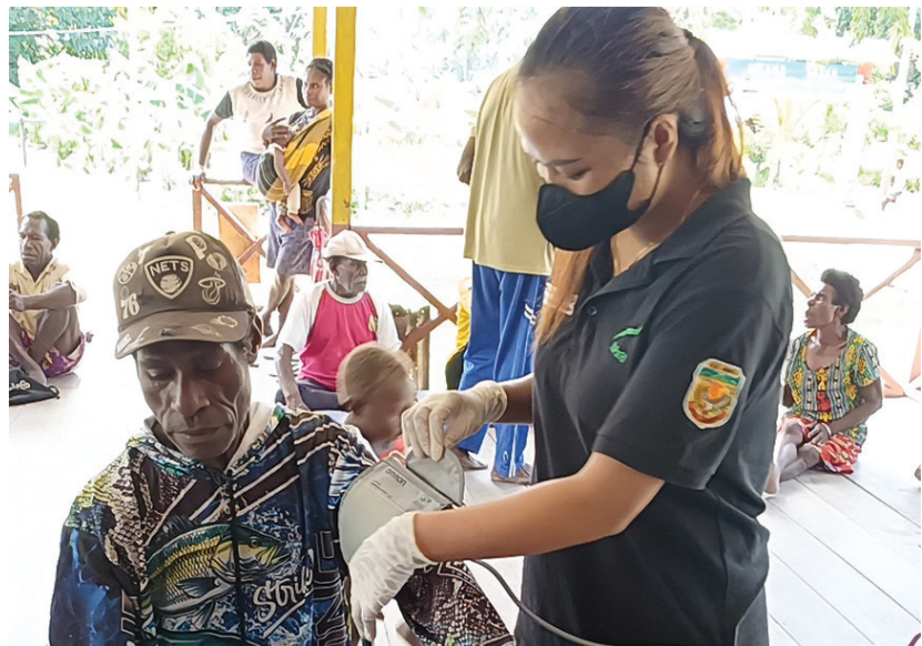
Pemeriksaan kesehatan warga di Kampung Wumuka oleh Tim Kampung Sehat YPMak dan Pustu Wumuka, Jumat (17/4).

Deteksi Dini Penyakit Tidak Menular Dalam perspektif kesehatan mas-