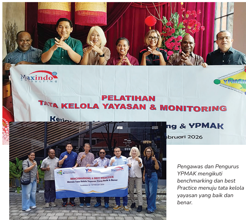
Pengawas dan Pengurus YPMAM mengikuti benchmarking dan best Practice menuju tata kelola yayasan yang baik dan benar.

Meskipun demikian, Bimo mengingatkan bahwa adanya tantangan