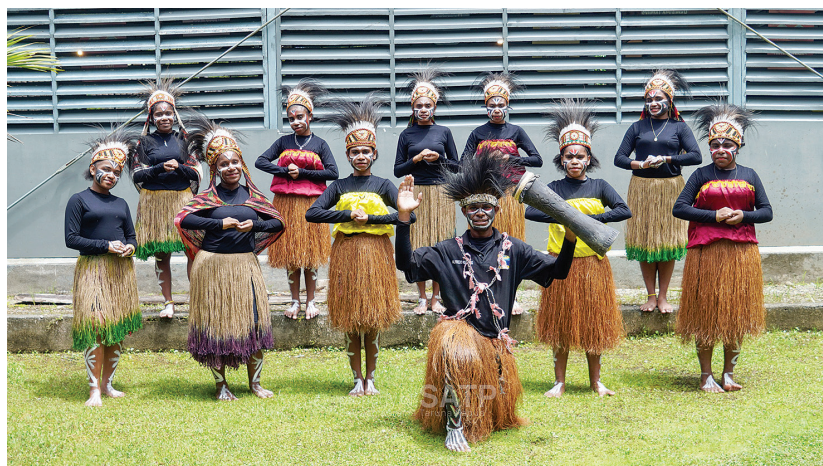
Grup tari Sekolah Asrama Taruna Papua.

Rangkaian prestasi ini menjadi bukti bahwa dengan ruang yang tepat dan dukungan yang konsisten, generasi muda Papua mampu bersinar di berbagai bidang, baik di lapangan olahraga maupun di panggung seni. Lebih dari sekadar kemenangan, ini adalah cerita tentang harapan, kebersamaan, dan masa depan yang terus tumbuh. (ots-1)