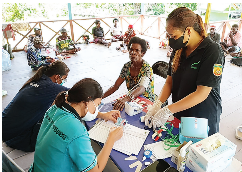
Pemeriksaan kesehatan oleh tim Kampung Sehat YPMak bekerjasama dengan petugas kesehatan Dinas Kesehatan Mimika.

Aktivitas fisik kolektif ini bukan sekadar kegiatan olahraga, tetapi menjadi medium sosial untuk memperkuat kesadaran kolektif tentang pentingnya gaya hidup sehat. Dalam konteks kesehatan masyarakat, intervensi berbasis