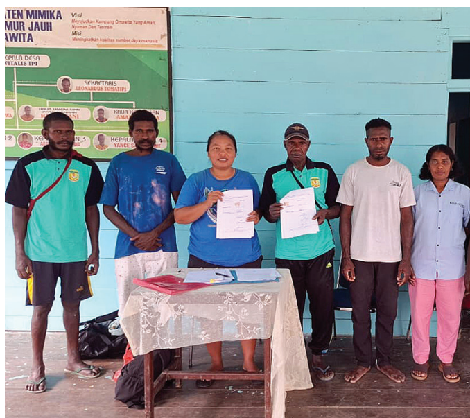
Foto bersama usai pembentukan Kelompok Kerja Program Kampung YPMK di Kampung Omawita.