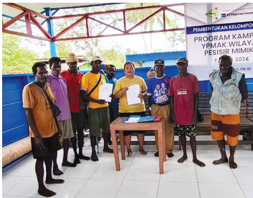
Foto bersama usai pembentukan kelompok kerja Program Kampung YPMak di Distrik Jita.

LPJ yang tepat waktu menjadi kunci penting untuk membangun kepercayaan, menjaga transparansi, dan memastikan manfaat program dapat terus dirasakan masyarakat secara berkelanjutan. (ots-1)