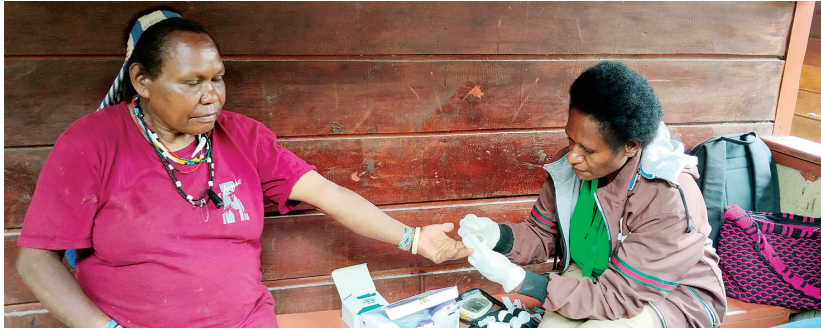
Petugas kesehatan saat skrining malaria di Kampung Beanegom, Distrik Tembapapura.

T ANTANGAN pelayanan kesehatan bukan hanya soal ketersediaan tenaga medis, tetapi juga menyangkut jarak, infrastruktur, dan keberlanjutan intervensi. Dalam konteks inilah, Program Kampung Sehat yang dijalankan Yayasan Pemberdayaan Masyarakat Amungme dan Kamoro (YPMAM) menghadirkan pendekatan berbasis komunitas untuk menjawab kesenjangan layanan kesehatan dasar.