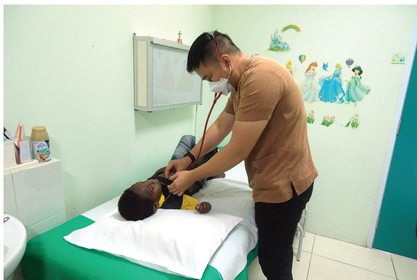
Dokter spesialis anak sedang memeriksa pasien di Poliklinik Anak RSMM.

Pembangunan fisik RSMM tergolong sangat cepat. Peletakan batu pertama dilakukan pada 4 Februari 1999 oleh Pater Bert Hogendoorn OFM, yang menjabat Ketua Pengurus