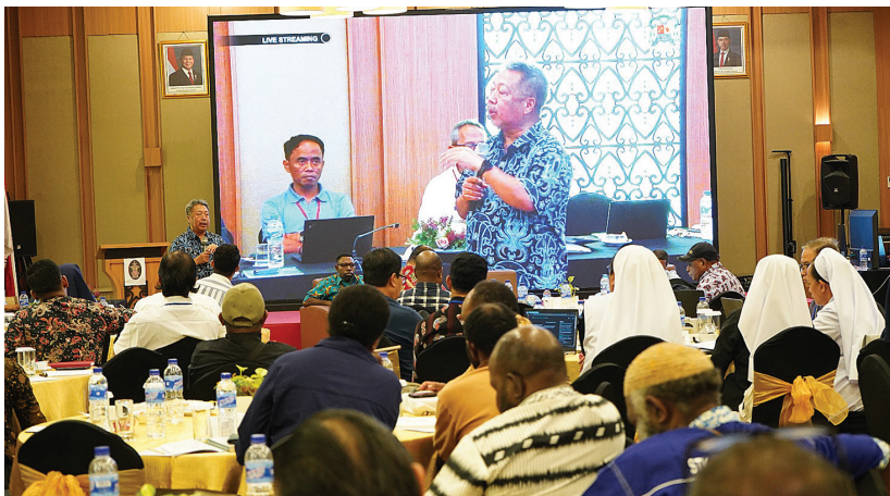
Suasana lokakarya pendidikan yang digagas oleh Keuskupan Timika, Kamis (16/4/2026).

Komitmen ini ditegaskan oleh PT Freeport Indonesia (PTFI) yang terus mengambil peran strategis dalam mendukung pengembangan pendidikan di wilayah operasionalnya. Bersama Pemerintah Kabupaten Mimika dan Keuskupan Timika, PTFI mendorong lahirnya pendekatan kolaboratif yang tidak hanya bersifat programatik, tetapi juga berorientasi pada solusi jangka panjang.