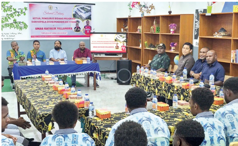
Pengurus YPMak melakukan kunjungan untuk memantau langsung perkembangan peserta didik penerima beasiswa di SMA Katolik Villanova, Manokwari, Papua Barat, Kamis (9/4).

Y AYASAN Pemberdayaan Masyarakat Amungme dan Kamoro (YPMak) sebagai pengelola dana kemitraan PT Freeport Indonesia, menempatkan pendidikan sebagai fondasi utama dalam membangun masa depan masyarakat asli Papua.