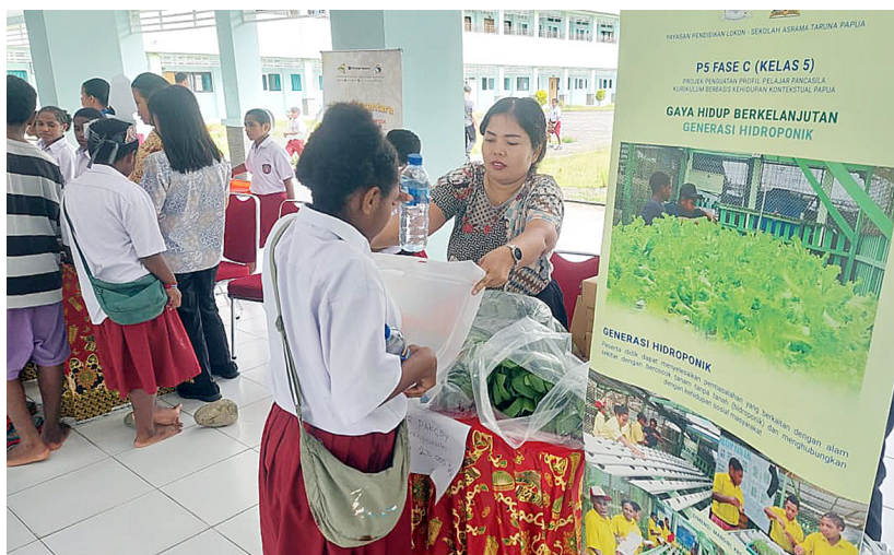
Suasana Kokurikuler Day di Sekolah Asrama Taruna Papua.

“Kokurikuler ini dibangun berdasarkan prinsip pembelajaran mendalam (deep learning). Artinya, pembelajaran harus menyenangkan, menggembirakan, dan sesuai dengan konteks anak agar tidak monoton di dalam kelas. Kegiatan ini bertujuan memperdalam dan memperkaya materi yang telah dipelajari di pagi hari,” papar Soni.