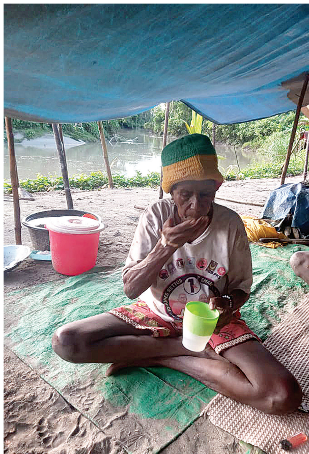
Pendampingan minum obat malaria, untuk memastikan obat diminum habis dan sesuai dosis. Petugas Kampung Sehat mendatangi pasien yang sakit malaria pada saat waktu minum obat malaria.

Model seleksi berjenjang ini mencerminkan prinsip good governance dalam pengelolaan program sosial, yakni transparansi, akuntabilitas, dan partisipasi. Keputusan akhir berada di tangan pengurus yayasan, yang akan menentukan