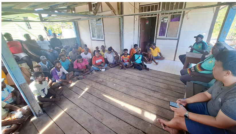
Suasana pembentukan Kelompok Kerja Program Kampung YPMK di Kampung Ohoty.

H ARAPAN baru tumbuh di sepanjang pesisir Mimika. Di tengah hamparan kelapa yang selama ini belum dimanfaatkan maksimal, masyarakat kini mulai bergerak bersama melalui Kelompok Kerja (Pokja) Program Kampung untuk mengembangkan budidaya kelapa secara lebih terarah dan berkelanjutan.