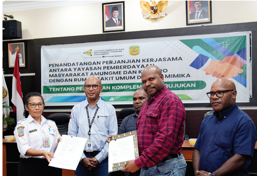
Ketua Pengurus YPMAK dan Direktur RSUD Mimika yang didampingi Ketua Pembina dan Ketua Pengawas YPMAK serta Wakil Ketua Program YPMAK saat menyerahkan perjanjian kerja sama pelayanan komplementer rujukan.

Ia juga menyoroti bahwa dukungan YPMAK tidak hanya mengikuti aturan baku, tetapi juga mempertimbangkan