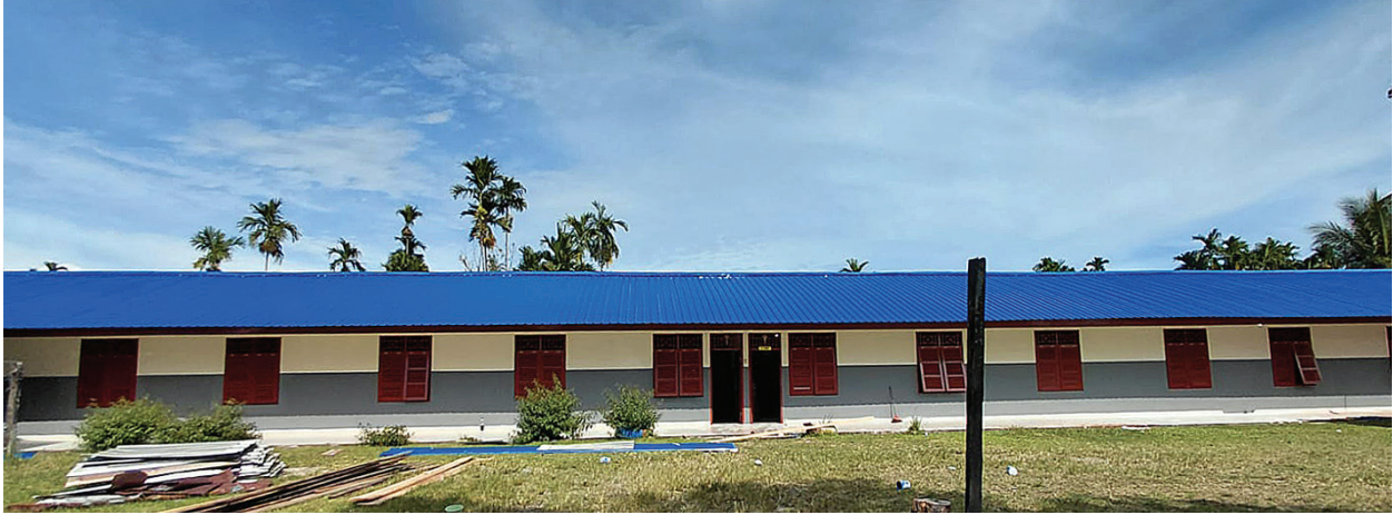
Rehab asrama Salus Populi di SP III.

K EPEDULIAN terhadap kenyamanan dan masa depan generasi muda terus diwujudkan oleh Yayasan Pemberdayaan Masyarakat Amungme dan Kamoro (YPMak). Melalui program rehabilitasi fasilitas hunian di Asrama Solus Populi, YPMak mengalokasikan anggaran sekitar Rp5 miliar pada tahun 2025 untuk memperbaiki berbagai sarana yang sudah tidak layak.