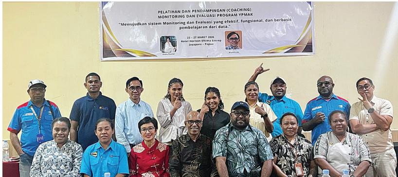
Foto bersama usai pelatihan dan pendampingan monitoring dan evaluasi yang diikuti oleh Divisi Monitoring Program Pendidikan, Kesehatan dan Ekonomi.

P ENINGKATAN kualitas program terus dilakukan oleh Yayasan Pemberdayaan Masyarakat Amungme dan Kamoro (YPMAK) selaku pengelola dana kemitraan PT Freeport Indonesia.