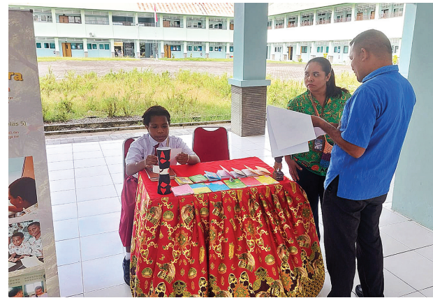
Seorang siswi Sekolah Asrama Taruna Papua menjaga stand saat Kokurikuler Day.

“Meski dilakukan di luar jam inti, kegiatan ini tetap terintegrasi dengan mata pelajaran seperti Seni Budaya, Pendidikan Pancasila, Bahasa Indonesia, hingga Pendidikan Lingkungan Hidup (PLH),” ungkapnya.