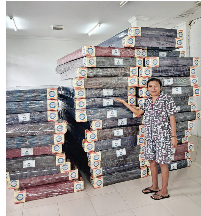
Pengadaan kasur bagi siswa siswi di Asrama Salus Populi SP III.

Asrama Solus Populi sendiri menjadi tempat tinggal bagi anak-anak asli Papua, khususnya dari suku Kamoro yang berasal dari wilayah pesisir barat hingga timur Mimika. Mereka menempuh pendidikan di