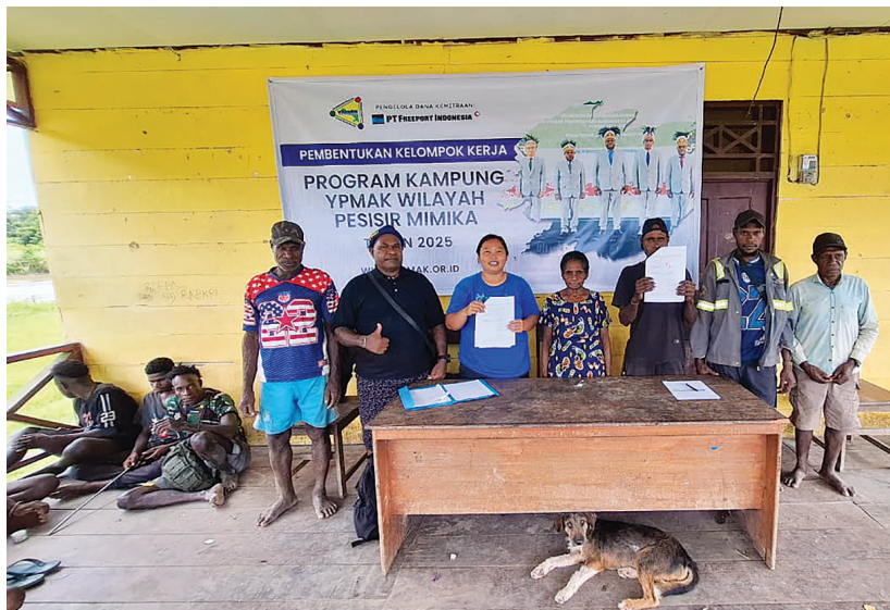
Foto bersama usai pembentukan kelompok kerja Program Kampung YPMak di Kampung Mafasimamo.

LPJ diserahkan di tahun berjalan, bukan ditunda hingga tahun berikutnya. Ketepatan waktu ini penting untuk menjaga kelancaran administrasi serta memastikan program dapat dievaluasi dengan baik,” ujarnya.