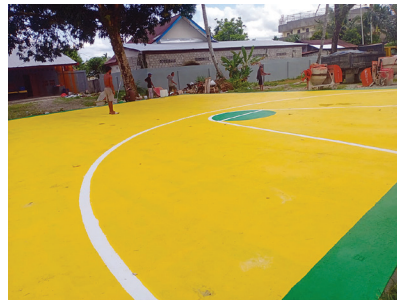
Fasilitas pendukung asrama Salus Populi di SP III, dapur dan lapangan olahraga juga di reovasi.