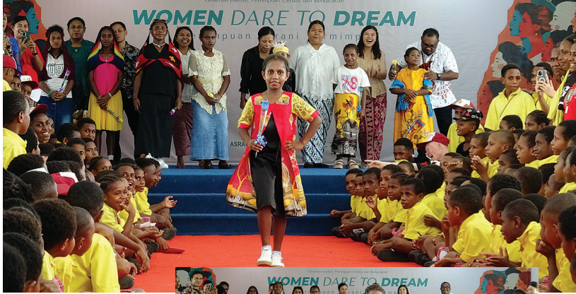
Lomba fashion show dalam menyemarakkan Hari Kartini, Selasa (21/4/2026).