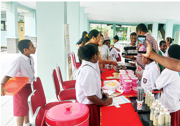
Suasana Kokurikuler Day di Sekolah Asrama Taruna Papua.

“Kegiatan ini baru pertama kali kami laksanakan tahun ini sebagai pengembangan dari program P5 sebelumnya. Guru dari level kelas 2 sampai 6 menyusun jadwal mingguan dan melibatkan siswa secara aktif dalam menentukan target ca-