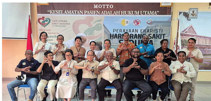
Peserta pelatihan dan pendampingan monitoring dan evaluasi foto bersama usai praktek monitoring di RS Dian Harapan Jayapura.

Dengan semangat baru ini, Monev diharapkan tidak lagi sekadar mencatat, tetapi benar-benar menjadi motor perubahan yang menghadirkan manfaat nyata bagi masyarakat. (ots-1)