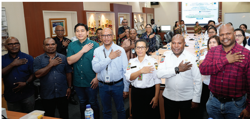
Foto bersama usai penandatanganan perjanjian kerja sama antara YPMAK dan RSUD Mimika.

Melalui langkah ini, YPMAK bersama RSUD Mimika menegaskan komitmen bersama, memastikan tidak ada lagi pasien yang harus berjuang sendiri, terutama saat menghadapi perjalanan panjang demi kesembuhan. (ots-1/ots-2)