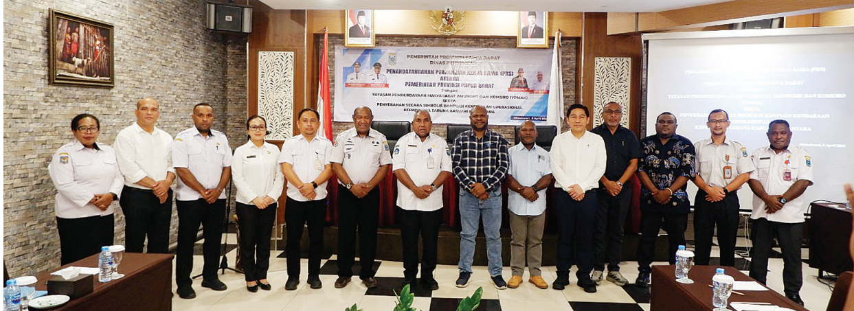
Foto bersama YPMAC dan Dinas Pendidikan Provinsi Papua Barat serta Kepala SMA TKN Nusantara Manokwari usai menandatangani nota kerja sama pengembangan SDM dengan SMA Taruna Kasuari Nusanantara di Manokwari, Papua Barat, Rabu (8/4/2026).

L ANGKAH Yayasan Pemberdayaan Masyarakat A3ungme dan Kamoro (YPMAC) memperluas kerja sama dengan SMA Taruna Kasuari Nusanantara bukan sekadar seremoni administratif. Di balik penandatanganan nota kesepahaman itu, tersimpan pergeseran pendekatan yang lebih mendasar—sebuah strategi baru dalam membangun sumber daya manusia (SDM) Papua yang berakar pada konteks lokal, namun berorientasi global.