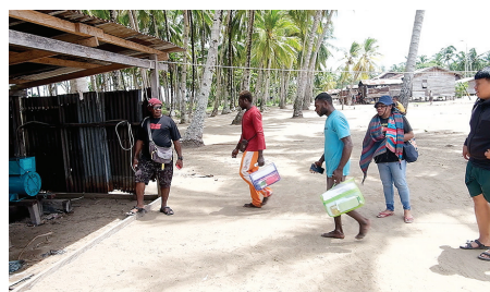
Kelompok kerja Program Kampung Aindua menunjukkan hasil dari program kampung YPMAC tahun anggaran 2023 berupa : pengadaan alat musik, speaker aktif, mesin genset dan renovasi pintu jendela gereja Katolik Hati Kudus Tuhan Yesus.