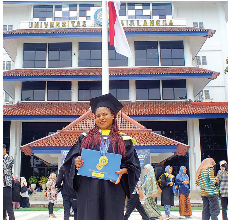
Salah seorang peserta beasiswa YPMAK yang telah lulus di Universitas Airlangga, Surabaya.