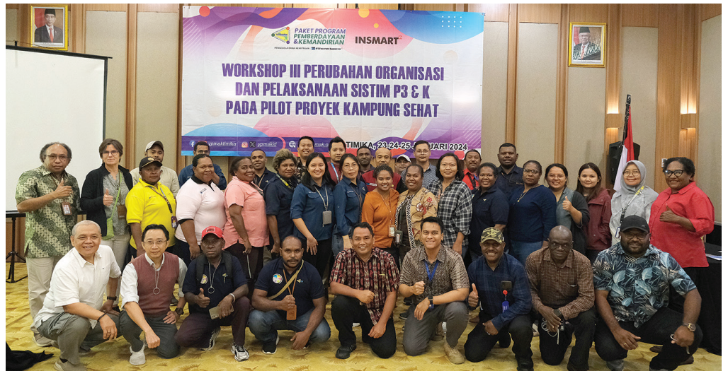
Foto bersama usai mengikuti workshop perubahan organisasi dan pelaksanaan sistim P3&K pada pilot proyek Kampung Sehat.

Dalam workshop selama tiga hari itu, dihasilkan enam SOP yaitu : SOP 1 tentang perencanaan, SOP 2 tentang penyusunan, SOP 3 tentang pengumuman, SOP 4 tentang seleksi, SOP 5a tentang pelaksanaan perjanjian kerjasama, SOP 5b tentang pelaksanaan pencairan dana, SOP 5c tentang pelaksanaan monitoring,