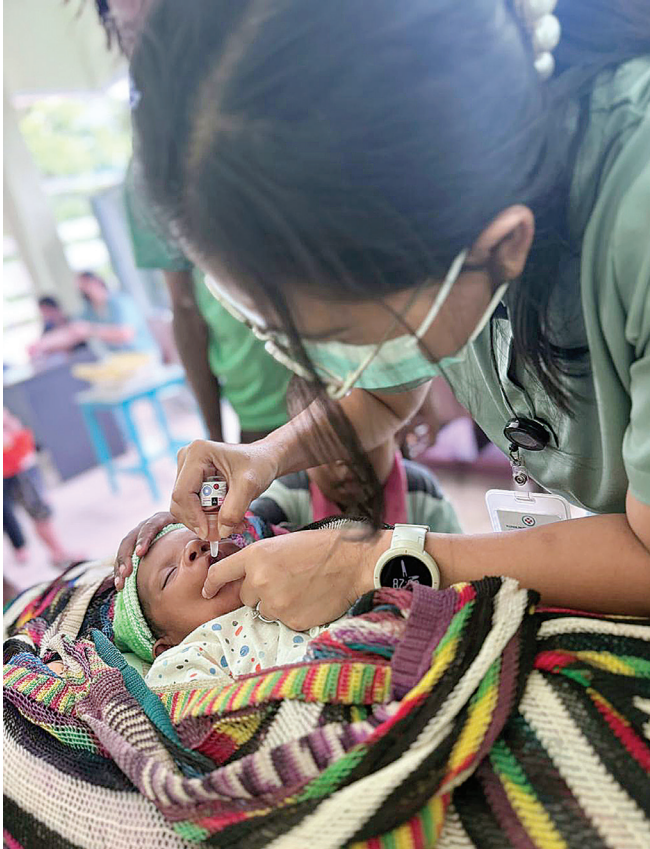
Petugas kesehatan Rumah Sakit Mitra Masyarakat memberikan vitamin pada anak.

Semua pasien wajib mentaati alur layanan yang telah ditetapkan oleh RSMM Berlaku sejak tanggal ditetapkan, 15 Juni 2023. (miskan)