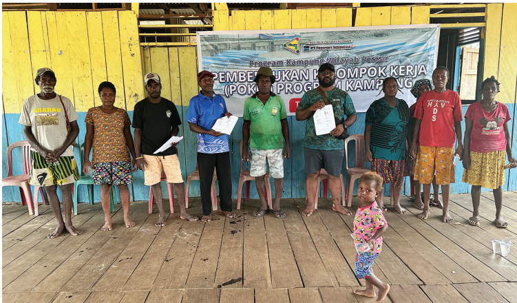
Foto bersama usai penandatanganan PKS antara YPMAC dan Pokja Kampung Umar Ararau.

Pembentukan pengurus kelompok kerja (Pokja) tahun 2024 di Kampung Umar Ararau, Distrik Mimika Barat Jauh, Kabupaten Mimika, Provinsi Papua Tengah, berlangsung dengan sukses pada Sabtu, 27 April 2024. Dalam acara tersebut, masyarakat sepakat untuk mempertahankan kepengurusan yang ada karena kinerja yang baik selama ini.