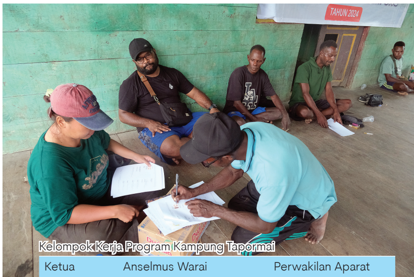
Kelompok Kerja Program Kampung Tapormai

"Kami harap ada koordinasi dengan pemerintah kampung agar segala kegiatan bisa dilakukan bersama-sama," singkatnya. (miskan)