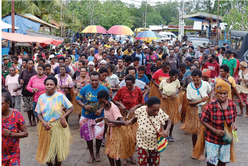
Mama-mama menyambut tamu dan undangan dengan tarian tradisional suku Koro saat peresmian Pasar Mama-mama di Paumako.

Y AYASAN Pemberdayaan Masyarakat Amungme dan Kamoro (YPMAK), sebagai pengelola Dana Kemitraan PT Freeport Indonesia, dengan bangga mempersembahkan Pasar Mama-Mama di Paumako. Pasar ini merupakan hasil dari Program Kampung yang bertujuan untuk meningkatkan kesejahteraan masyarakat lokal, terutama para mama-mama yang selama ini berjualan di bawah terik matahari.