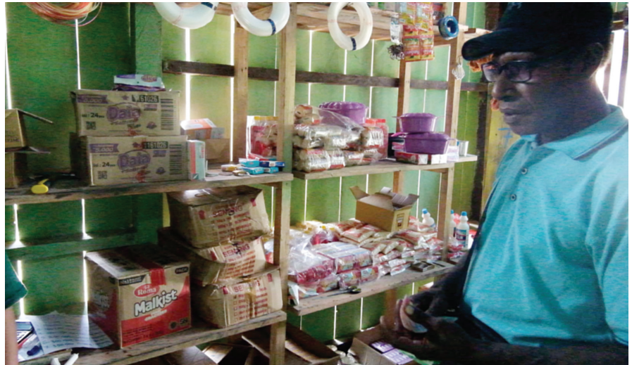
Kios Kampung yang dibangun melalui Program Kampung YPMAC di Kampung Tapormai.

"Semua program sudah ada bukti dan kini telah dirasakan oleh masyarakat. Kalau terkait pengurus pokja baru semua tergantung dari