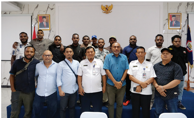
Monitoring Program Pendidikan di Universitas Surya Dharma Jakarta.