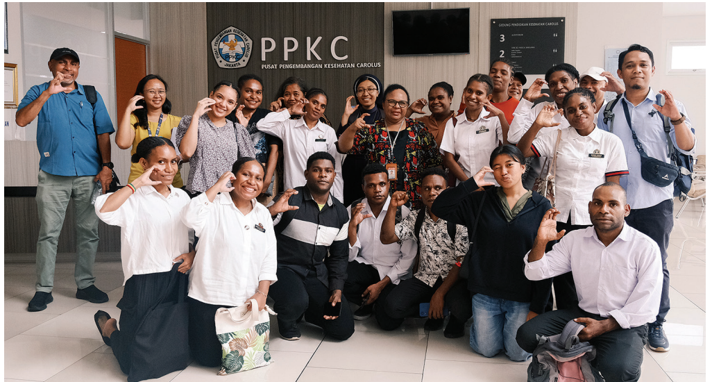
Monitoring Program Pendidikan di STIK Sint Carolus Jakarta.

Ia menambahkan bahwa peserta juga harus mengikuti aturan yang diterapkan di lingkungan akademik dan asrama, yang merupakan kebijak-