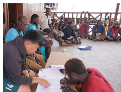
Penandatanganan perjanjian kerjasama antara YPMAC dan Kelompok Kerja Program Kampung Aindua.